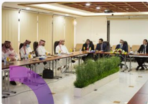
المستشفى السعودي الألماني جدة