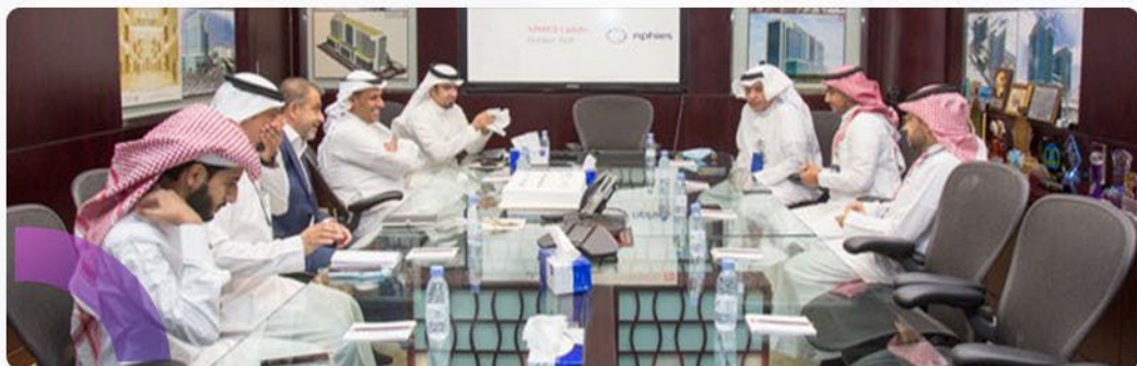
مستشفى الحبيب الرياض

زيارات المجلس التفقدية لمنشآت المرحلة الأولى من منصة نفيس للخدمات التأمينية