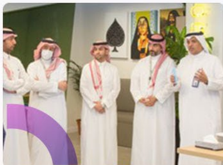
شركة التعاونية الرياض