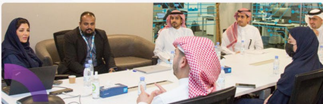
شركة بوبا جدة